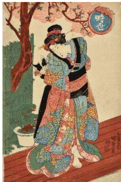
「時世」歌川国貞 文政後期 ／中右コレクション

期 日：4/20(土)～6/9(日) 休 館 日：毎週月曜日(祝日の場合は翌平日) 開 館 時 間：9:30～17:00 (観覧券の販売は16:30まで) 会 場：県立歴史博物館 企画展示室 (長岡市関原町1-2247-2) 観 覧 料：一般840円、高校・大学生600円、 中学生以下無料